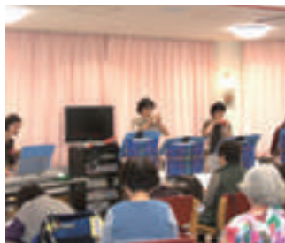
デイケア行事(オカリナ演奏)