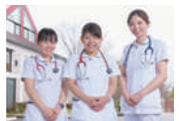
患者さんを笑顔でサポート