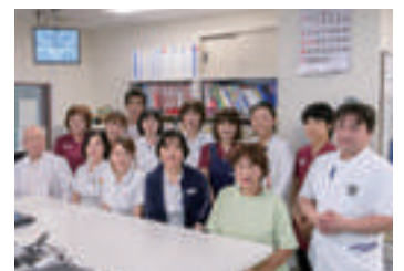
病棟スタッフの皆さん