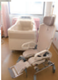
利用者さんの状態に合わせた入浴機器を設置