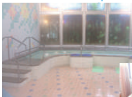
しあわせの村温泉と同じ泉質の浴場