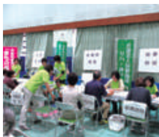
骨量・体組成測定