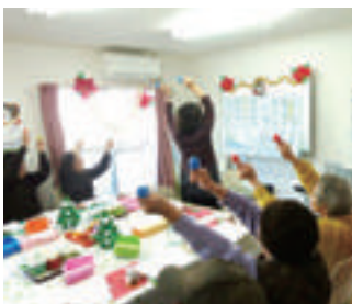
地域での音楽療法