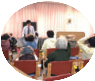
デイケア行事(脳ワクワク)