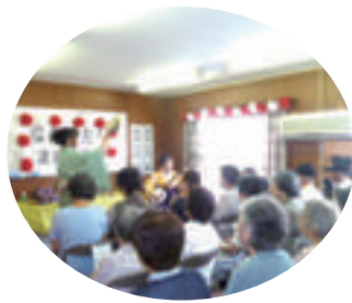
地域での敬老お祝会