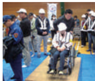
地域の方に車椅子の指導