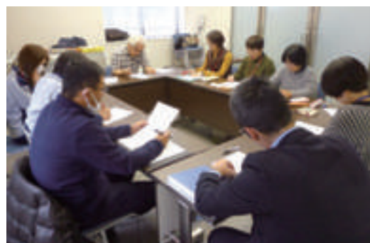
チーム員会議風景