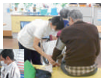
利用者さんそれぞれの状態に合わせたリハビリテーション