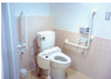
トイレ バリアフリー