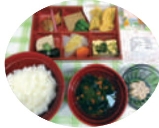
季節を感じる行事食