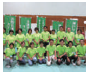
職員の皆さんお疲れ様