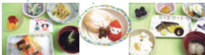
季節を感じていただける食事やおやつ