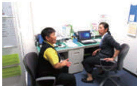
医療介護サポートセンターの執務風景

医療介護サポートセンターでは、医療と介護の知識に精通したコーディネーターが医療・介護関係者からの在宅医療に関する相談に応じるほか、多職種連携会議や在宅医療・介護に関する研修会の開催、在宅医療に関する市民啓発などを行っています。