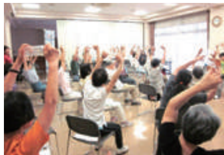
介護予防啓発運動(地域との交流会)