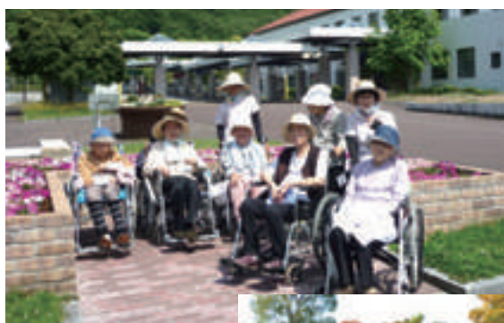
恵まれた自然環境を活かした散策会