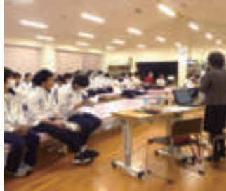
職員研修会の様子