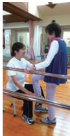
リハビリ訓練の様子

入院案内 入院を希望される方は、総合支援相談室でご相談ください。 (TEL:078-743-8200(代表)、平日9:00~17:30受付)