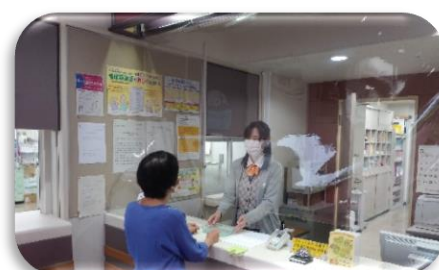
窓口もビニールシールドで飛沫対策