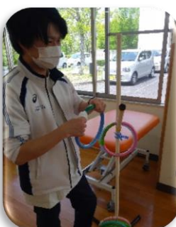
除菌シートで隅々まで拭き取り